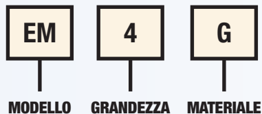
TABELLA DI SELEZIONE MANICOTTI EM